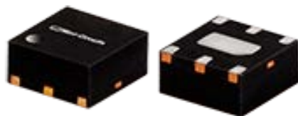
QAT Series Fixed Attenuator Case Style MC3000 2 x 2 x 1 mm