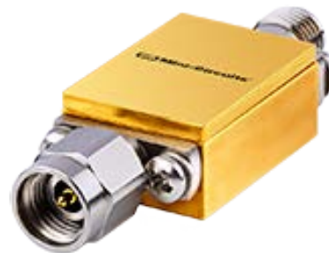
Case Style RA2937 20.3 x 14.2 x 8.8 mm (コネクタ部含まず)