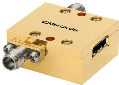
Case Style MS3009 30.5 x 26.3 x 13.3 mm (コネクタ部除く)