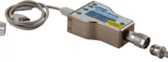
PWR-8P-RC 10 ~ 8000MHz 外部トリガ対応