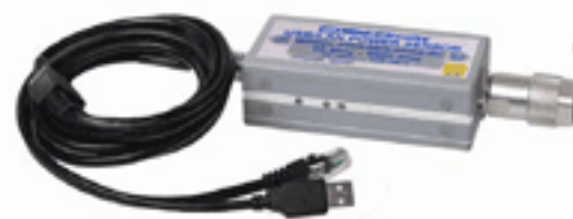
PWR-8GHS-RC 1 ~ 8000MHz